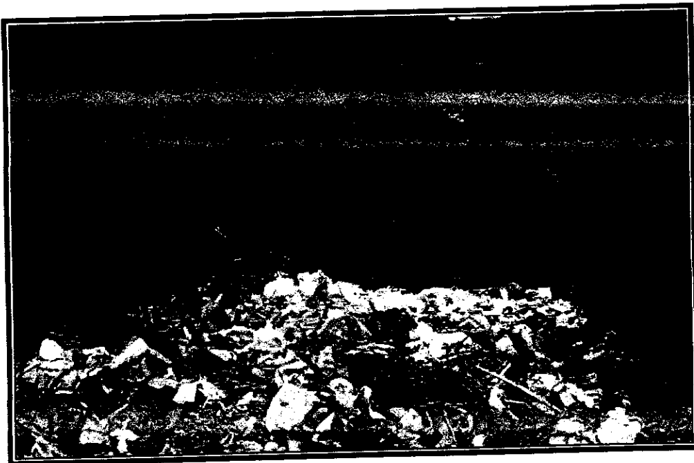
Foto 4 Botadero en el muro de contención vía por tu bien