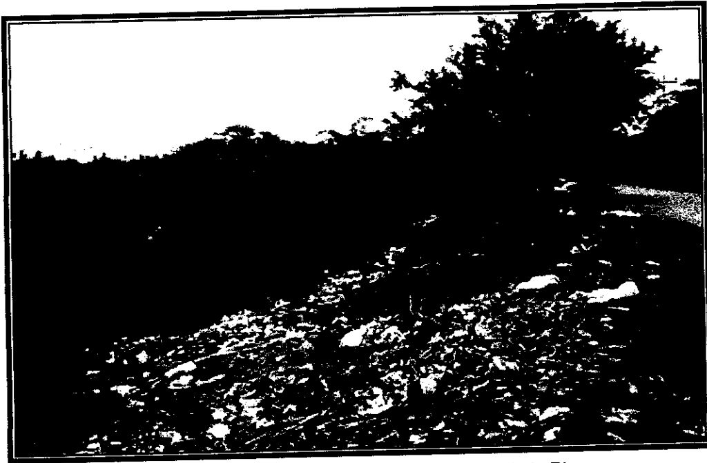
Foto 3 Botadero en el muro hacia el sector de la Playa