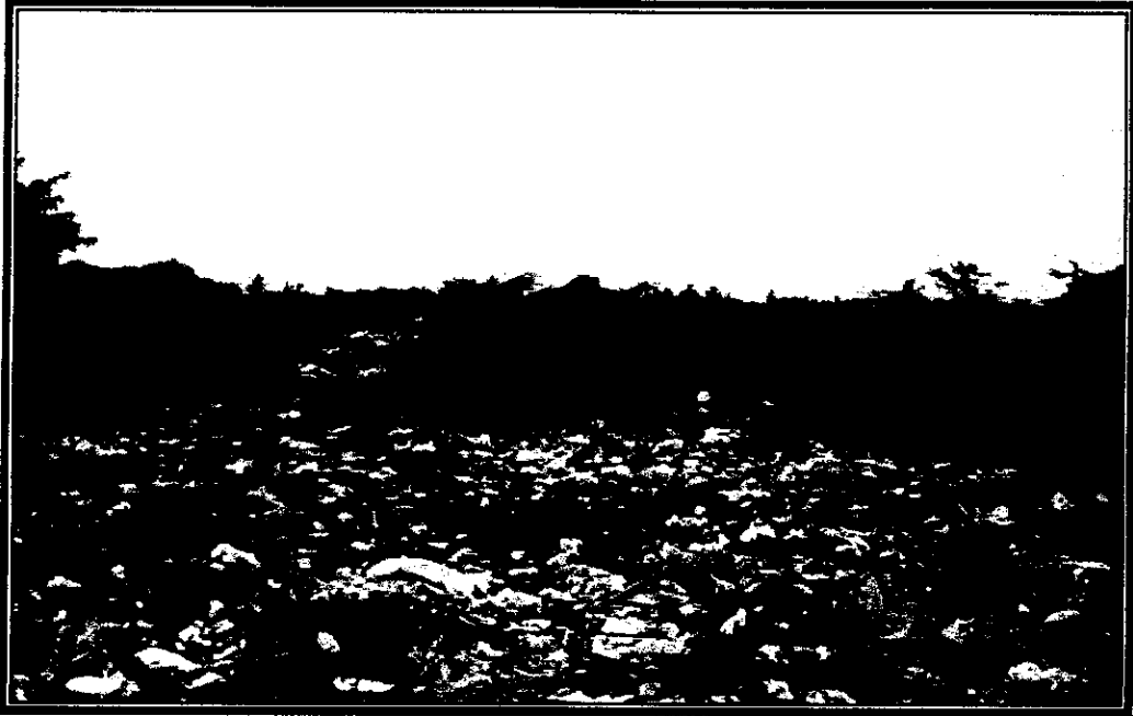
Foto 11 Botadero entrada a Villa Josefa lote abierto de unas 10 Ha lleno de Basura