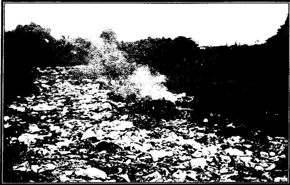
Foto 7 Botadero camino al antiguo relleno sanitario de Palmar a 50 mt, camino a Burrusco