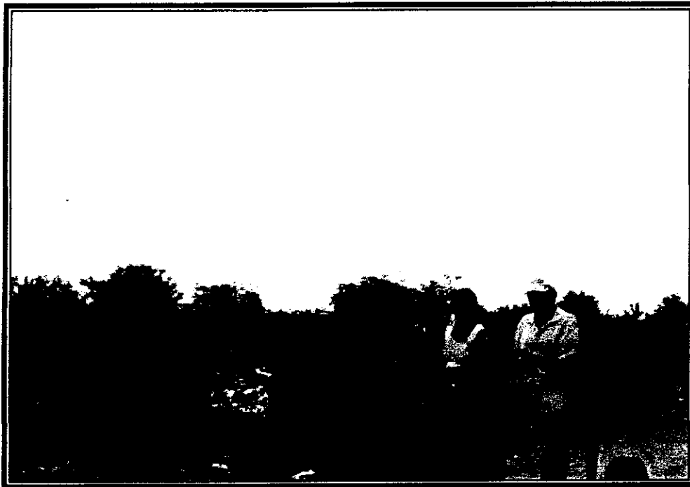
Foto 9 Botadero camino al antiguo relleno sanitario de Palmar a 150 mt, camino a Burrusco, presencia de carro muleros.