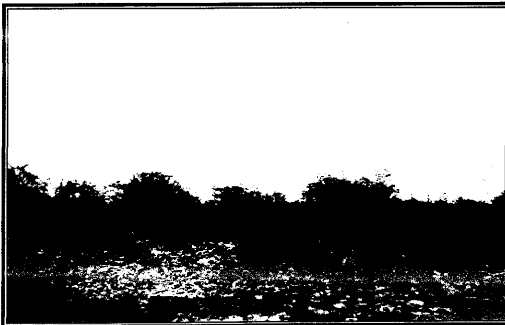
Foto 10 Botadero camino al antiguo relleno sanitario de Palmar a 200 mt, camino a Burrusco