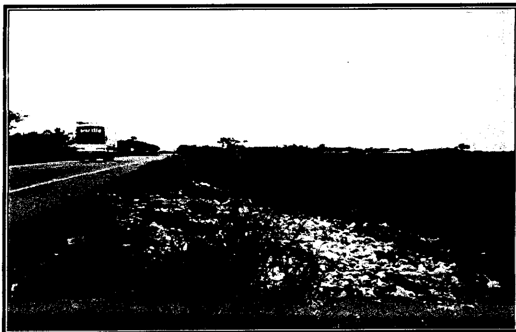
Foto 6 Botadero al frente del vivero orgánico la cuna verde, en la margen derecha de la vía la Oriental