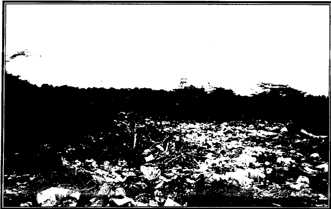
Foto 12 Botadero frente al Colegio Agropecuario, lote abierto