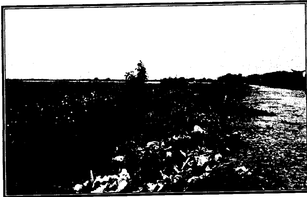
Foto 1 Botadero en el recorrido del muro de contención el punto que colinda Palmar de Varela con Santo Tomas.