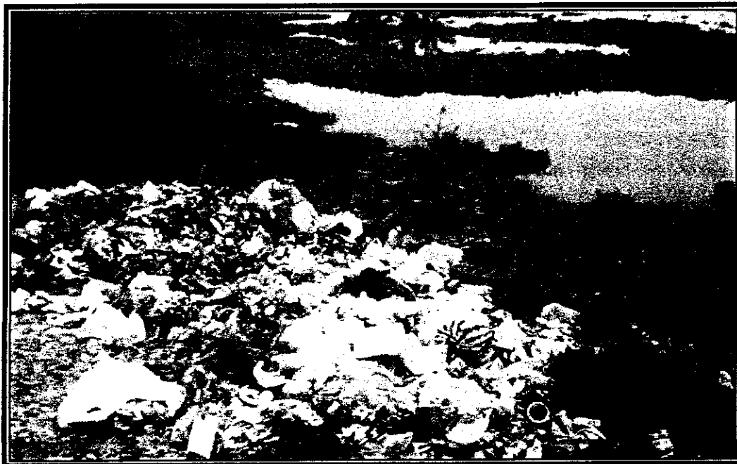
Foto 5 Botadero en la vía al estadero Sin Par