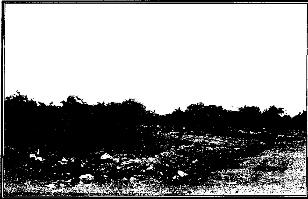
Foto 8 Botadero camino al antiguo relleno sanitario de Palmar a 100 mt, camino a Burrusco