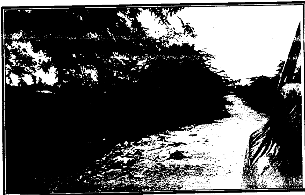
Foto 2 Botadero en el recorrido del muro de contención de Palmar de Varela a 5 mt de la Cienaga